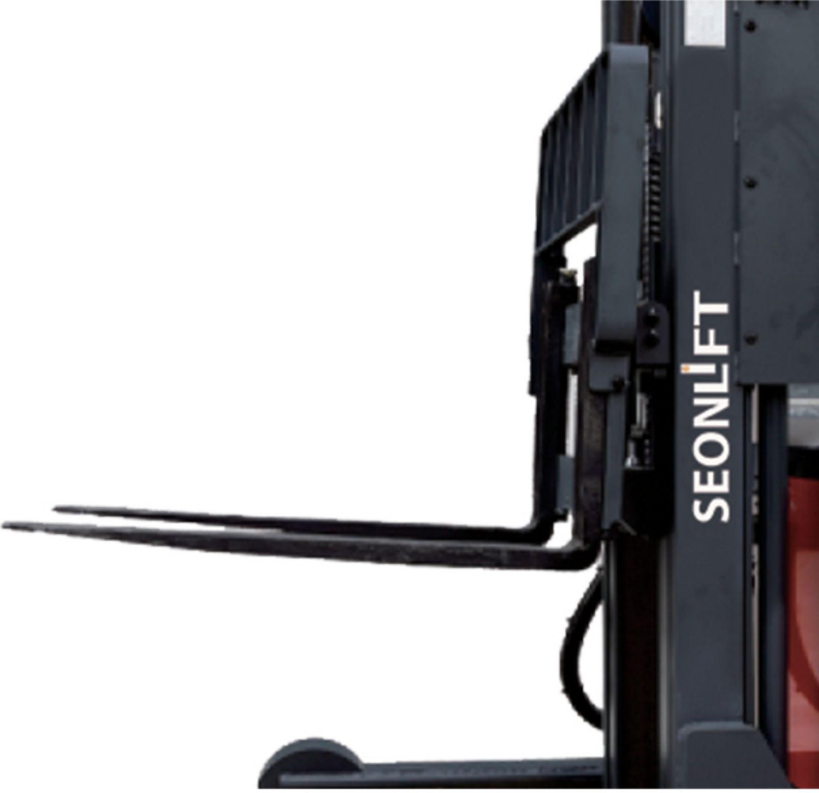
Çatal Tilti Fork Tilting