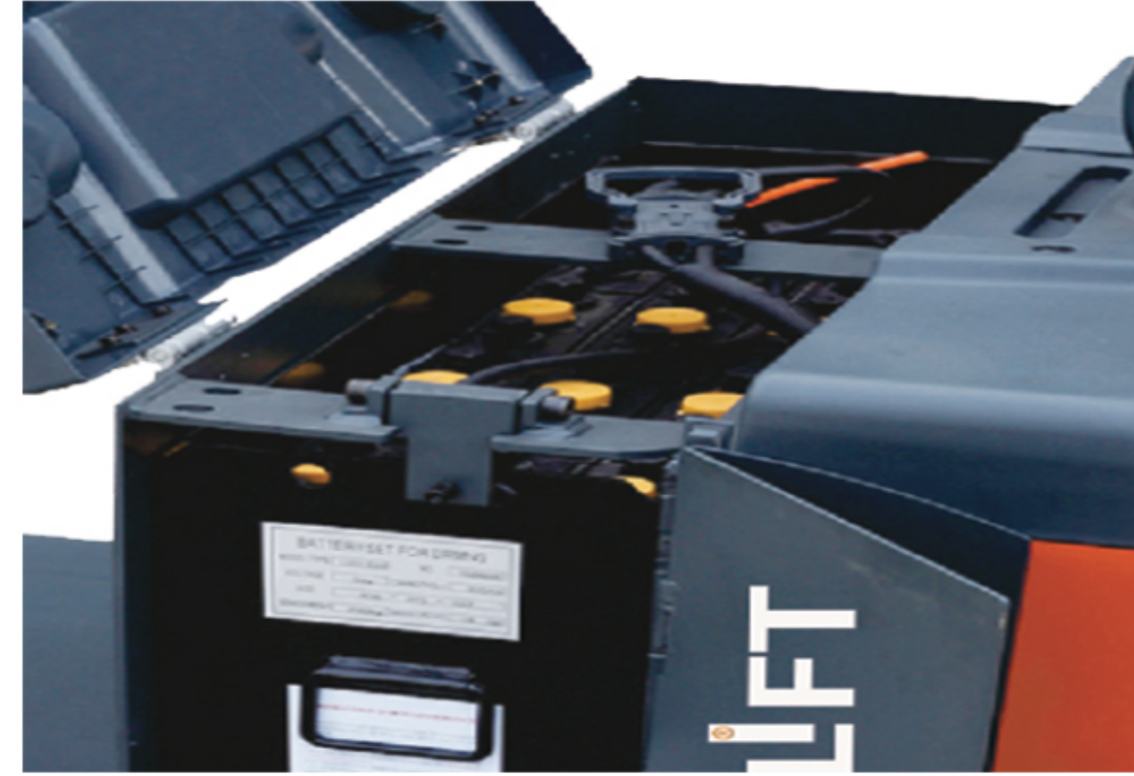
Yüksek Kapasiteli Akü High Capacity Battery